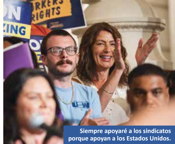
Siempre apoyaré a los sindicatos porque apoyan a los Estados Unidos.